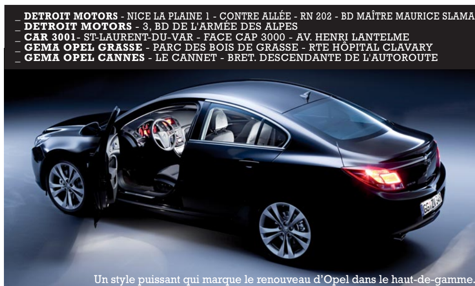
Un style puissant qui marque le renouveau d'Opel dans le haut-de-gamme.