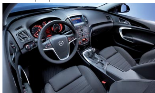
Fluide et dynamique, l'habitacle est en harmonie avec l'extérieur.

Premier contact visuel : séduction. La belle affiche une ligne à la fois fluide et puissante qui s'aventure sur les territoires jusqu'alors réservés aux ténors germaniques. Le blason au blitz – qui a également fait l'objet d'un heureux lifting – reçoit désormais le nom de la marque en toutes lettres. Autant d'indices révélant qu'Opel entre dans une nouvelle ère !