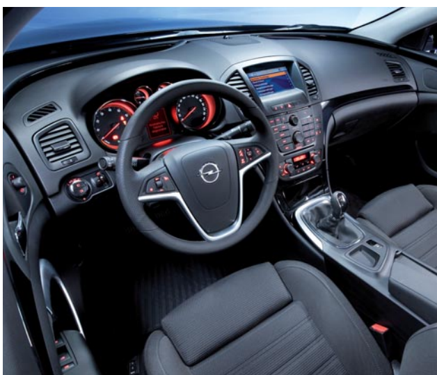
Fluide et dynamique, l'habitacle est en harmonie avec l'extérieur.

Premier contact visuel : séduction. La belle affiche une ligne à la fois fluide et puissante qui s'aventure sur les territoires jusqu'alors réservés aux ténors germaniques. Le blason au blitz – qui a également fait l'objet d'un heureux lifting – reçoit désormais le nom de la marque en toutes lettres. Autant d'indices révélant qu'Opel entre dans une nouvelle ère ! À l'intérieur, le charme opère à nouveau. L'habitacle est pourvu d'un tableau de bord aux lignes contemporaines qui confirme la montée en gamme du constructeur. La qualité des matériaux met en valeur une instrumentation soignée et l'impression de confort règne. On découvre avec plaisir