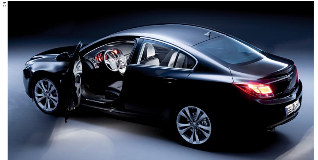
Un style puissant qui marque le renouveau d'Opel dans le haut-de-gamme.

L'Insignia impose son style dans la gamme des berlines familiales au caractère sportif. Ses points forts : de nombreuses innovations technologiques et un design « zéro défaut » qui marque de toute évidence la volonté d'Opel de proposer un modèle excitant.