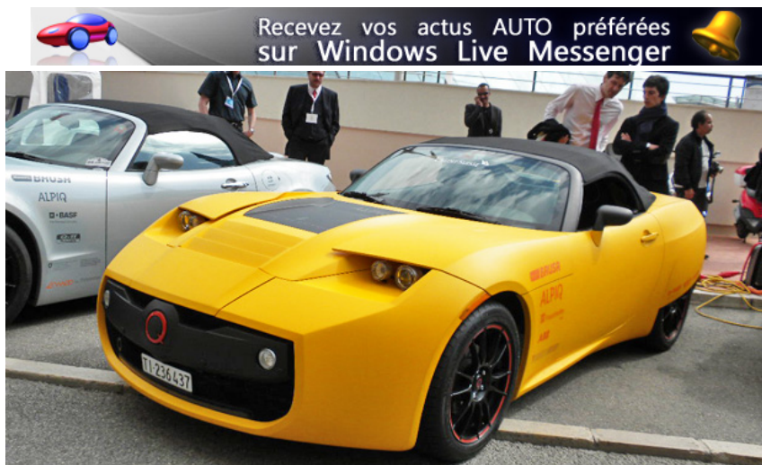
Légende photo : Salon Ever Monaco 2010