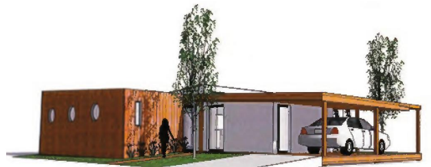
ROLEX - LEROY - WANG - DR

Toiture végétalisée, panneaux solaires, doubles vitrages peu émissifs, chaudière à condensation, ventilation double flux... Conçue par le journaliste scientifique Michel Chevalet et inaugurée au Salon Ever Monaco 2009, la Maison des gestes et du développement durable ( ci-dessous ) entend montrer au public comment fonctionne un bâtiment basse consommation. Parrainé par l'Ademe, la fondation Albert-II de Monaco et GDF Suez, ce parcours pédagogique et ludique (quiz, etc.) achèvera son tour de France en 2011 ■ B.M-V.