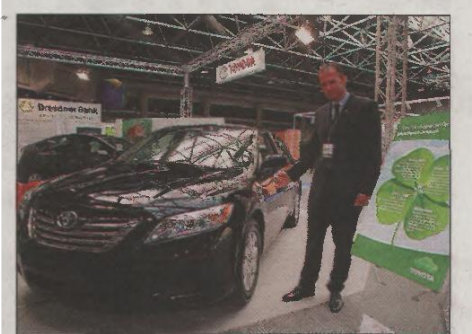
Le stand Toyota-Lexus propose quatre modèles de véhicules hybrides dont la Toyota Camry, destinée au marché monégasque.

Conscient de la prochaine explosion du marché des transports écologiques, les constructeurs n'ont pas perdu de temps. Et Toyota, placée en tête des marques mondiales automobiles est loin d'être en reste. Précurseur des véhicules hybrides avec la Prius en 1997, Toyota continue sur sa lancée et propose aujourd'hui du haut de gamme avec deux modèles de Lexus. La GS 450h, première berline sportive hybride à haute performance qui a l'accélération d'une Porsche et consomme seulement 5 litres au 100. Autre modèle encore plus inattendu : le 4x4 RX 400h, premier du genre. Mais la véritable surprise reste la Toyota Camry. Afin d'élargir l'offre du marché des véhicules hybrides à Monaco et de répondre au souhait du gouvernement